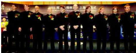
Cita de maestros Nadal posa ayer junto a los otros participantes en el Masters de Shanghái. En la imagen, de izquierda a derecha. Ancic y Berdych, que acuden como reservas, Blake, Davydenko, Federer, Ljubicic, Nadal, Nalbandian, Robredo y Roddick.