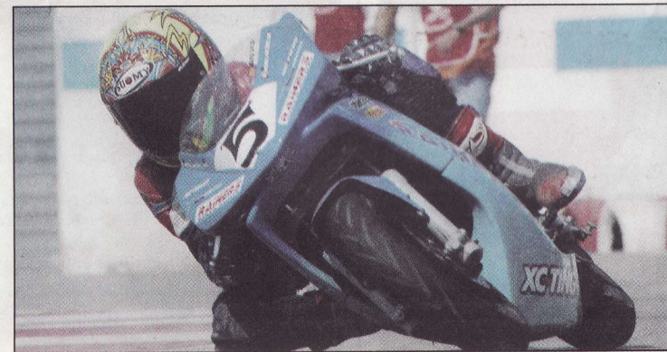
El pilot surienc durant la cursa del Mundial que va córrer a Estoril.

Sí, i sé que hauré de sacrificar moltes coses si algun dia vull arribar-hi. Tanmateix, crec que si continuo entrenant amb il·lusió i esforçant-me ho podré aconseguir. És qüestió d'anar fent currículum, acumular èxits i despertar l'interès dels equips. Ara m'he